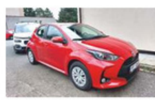
Pečovatelka a zdravotní sestry centra sociálních služeb Doma ve Kdyni jezdí po celé Kdyni, ale také mimo její hranice.