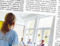
Začínáme bychom měli zmínit, že ke každému z nás patří nějaká služba, která nám pomáhá žít. V Domažlicích, kde je to naše organizace, která nám pomáhá žít. V Domažlicích, kde je to naše organizace, která nám pomáhá žít.