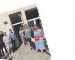
AKCE PRO SENIORY BĚŽÍ DÍKY SPOLUPRÁCI

PŘEŠIRANČNÍ NAVŠTĚVA Cháši bychom se také pochlubit můžeme návštěvou, kterou jsme u nás přivítali díky