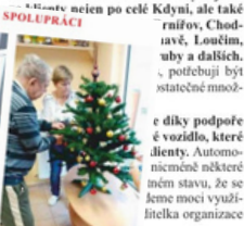
Všechno začíná se našimi klienty, kteří přicházejí do naší organizace. Všechno začíná se našimi klienty, kteří přicházejí do naší organizace.